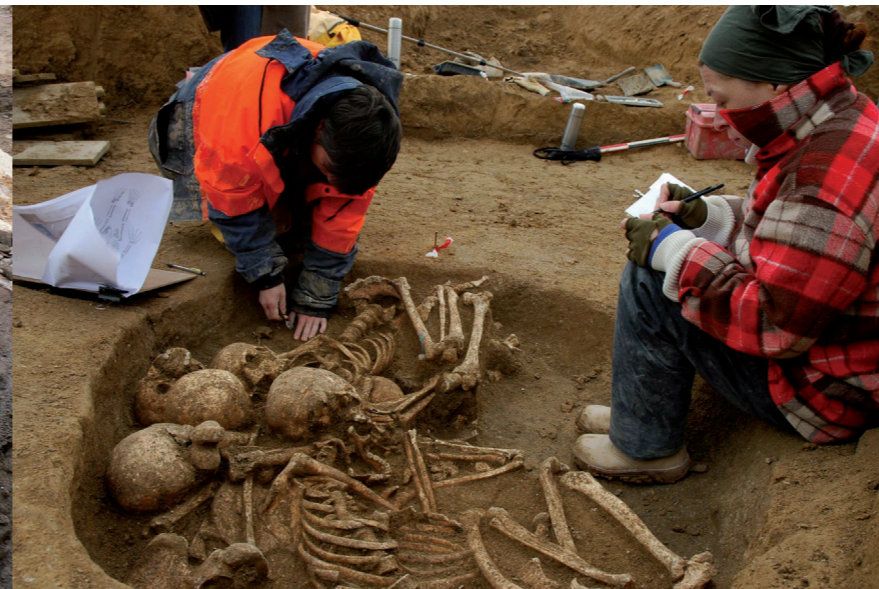
Prélèvement des ossements d'une sépulture multiple du Néolithique