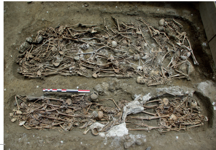
Charniers en cours de fouille (place des Jacobins, Le Mans)

Sauf conditions exceptionnelles, comme pour les corps retrouvés dans les tourbières, le squelette est la seule partie du corps humain à se conserver longtemps après la mort. Son degré de préservation dépend du terrain dans lequel il est enfoui, mais aussi du traitement qu'a subi le corps du défunt. L'inhumation peut être individuelle ou collective, sommaire ou élaborée ; il peut s'agir d'une crémation, avec recueil des os calcinés. Les rites funéraires sont aussi anciens que l'humanité et très variables suivant les cultures. L'anthropologue tente de reconstituer les gestes mortuaires par l'étude de l'architecture de la tombe, par les vestiges présents et la position des os. L'étude des sépultures offre une grande richesse d'informations sur le passé.