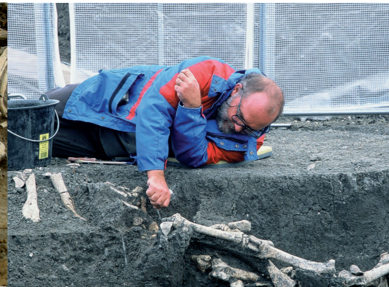
Dégagement des ossements d'un cheval Tombe gauloise à Orcet (Puy-de-Dôme), âge du Fer

De la Préhistoire à nos jours, l'Homme a toujours entretenu avec l'animal une relation étroite et complexe. L'archéozoologie s'intéresse aux nombreux aspects de cette relation : art de la chasse, domestication, pastoralisme, goûts alimentaires, etc. En complément d'autres sciences de l'environnement, elle fournit des informations concrètes sur les rythmes d'occupation d'un site, l'évolution des paysages et l'impact écologique de l'homme sur son milieu. Le grand nombre d'espèces étudié explique la création de plusieurs spécialités autour des différentes classes d'animaux (mammifères, oiseaux, poissons, etc.). Les méthodes de travail sont issues de disciplines proches comme la zoologie, la paléontologie et la médecine vétérinaire.