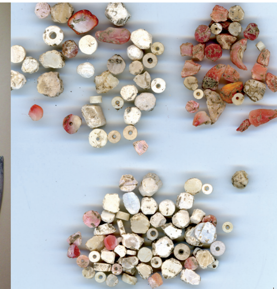
Perles en coquillage Strombus gigas, Chama sarda et Spondylus americanus

L'animal est source d'inspiration comme en témoignent les peintures rupestres, les représentations et les objets zoomorphes. Il est aussi source de matière première : os, ivoire, bois de cerf, coquilles, fourrures, peaux, tendons et plumes. L'animal, de son vivant, peut lui-même faire l'objet de modification d'ordre esthétique. Parfois vénéré, compagnon ou objet de tabous, il est souvent impliqué dans des pratiques rituelles ou religieuses : sacrifices, dépôts funéraires, porte-bonheur, etc. Le contexte de la découverte, les vestiges archéologiques associés, les sources écrites, l'iconographie sont autant d'éléments qui peuvent renseigner l'archéozoologue sur le statut des animaux.