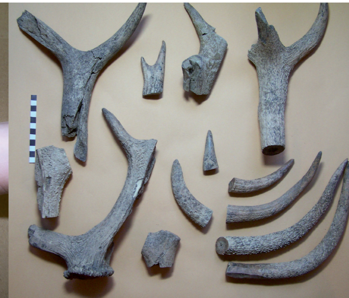
Fragments de bois de cerf provenant d'un atelier de débitage Villeparisis (Seine-et-Marne), Antiquité gallo-romaine

La détermination du sexe et des âges d'abattage permet de comprendre les finalités d'un élevage : alimentation, industrie textile, labour, transport, etc. L'observation des traces permet de reconstituer les gestes de l'homme : techniques de boucherie, préparation culinaire, procédés de conservation, travail de l'artisan. Les pathologies observées traduisent les efforts fournis par les animaux mais aussi leurs conditions de vie ; l'analyse des déjections et des parasites, donne également une bonne idée du niveau de santé. L'étude des tailles et des morphologies permet de mettre en évidence des processus de domestication ou de comparer des cheptels. La détermination des âges des espèces sauvages donne des informations sur la saisonnalité des activités de chasse, pêche et collecte.