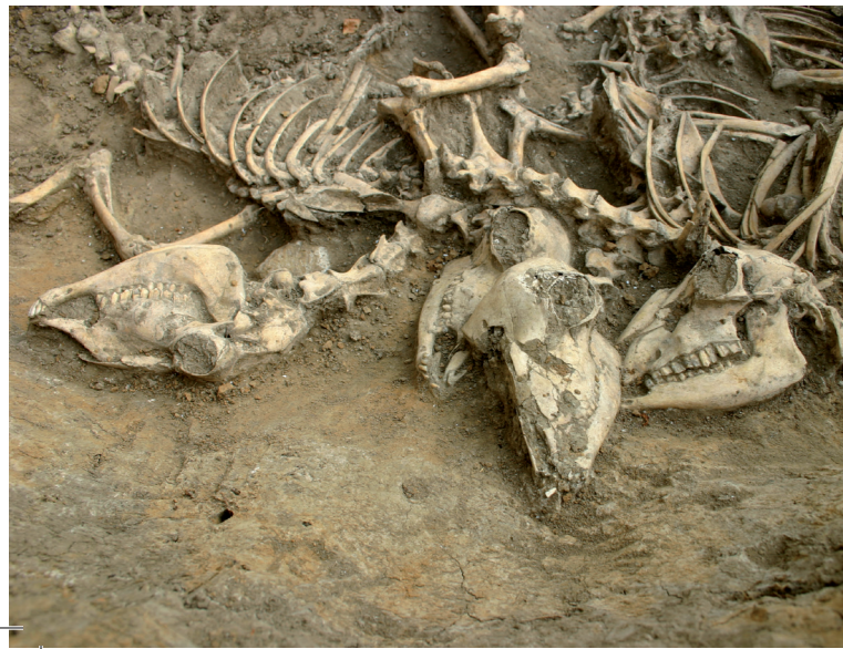
Concentration de squelettes de moutons Villiers-le-Bel (Val-d'Oise), Moyen Âge

Des restes animaux sont souvent retrouvés lors de fouilles archéologiques. Les matériaux les plus résistants au temps sont l'os, le bois de cervidés, l'ivoire et l'émail dentaires, les formations calcaires (coquilles et opercules de mollusques). Dans des contextes propices à une bonne conservation, on peut retrouver des restes plus fragiles : excréments fossiles, parasites, élytres d'insectes, écailles de poisson, coquilles d'œuf, pelages et plumes. Si ces restes animaux résultent parfois de dépôts naturels – reliquats de repas de prédateurs ou mort naturelle sur le site – ils sont le plus souvent issus des activités humaines comme la chasse, la pêche, l'élevage, l'alimentation, l'artisanat ou le culte.