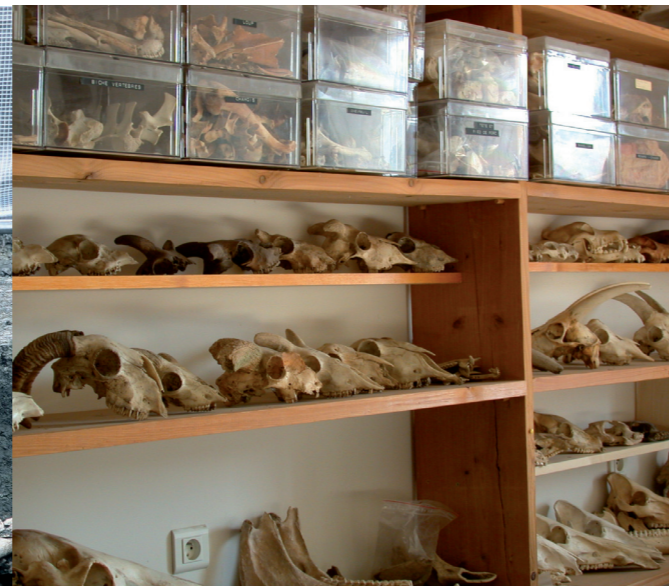
Collection de référence Laboratoire d'archéozoologie de Compiègne © Cravo

Lors de la fouille, l'archéozoologue trouve et prélève des squelettes complets d'animaux inhumés, des quartiers d'animaux donnés en offrande, des concentrations de restes mélangés (amas, dépotoirs) ou encore, des fragments isolés en contexte d'habitat. En laboratoire, il procède au tri et à l'analyse de ses prélèvements ou de ceux que l'archéologue lui a remis dans des sacs étiquetés. Ses principaux outils de travail sont : une collection de référence constituée de spécimens animaux actuels ou fossiles lui servant de point de comparaison, des planches anatomiques, un pied à coulisse et un ordinateur.