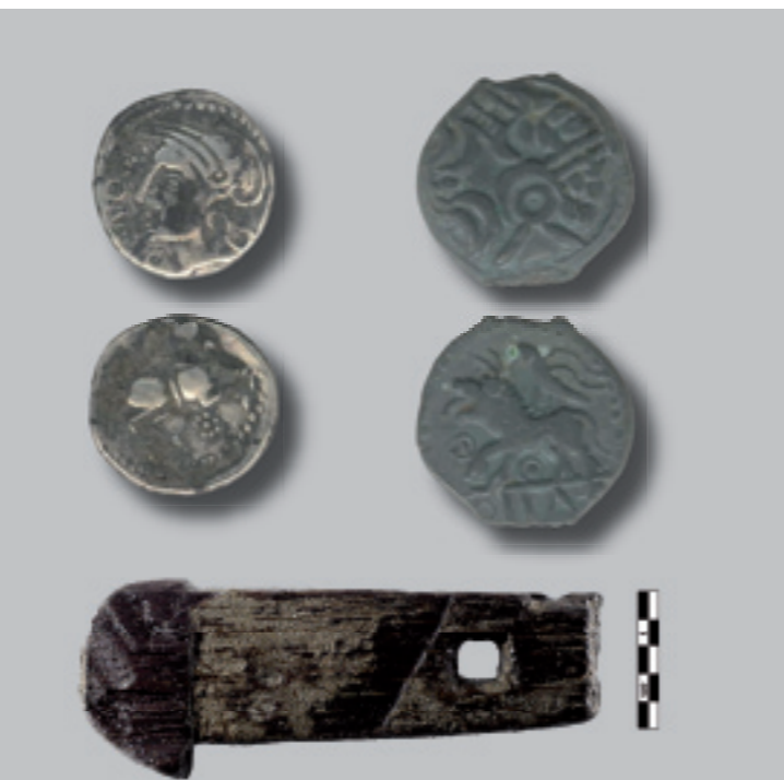
Clé d'assemblage en chêne découverte dans la rivière, I er siècle

Monnaies gauloises découvertes sur le site