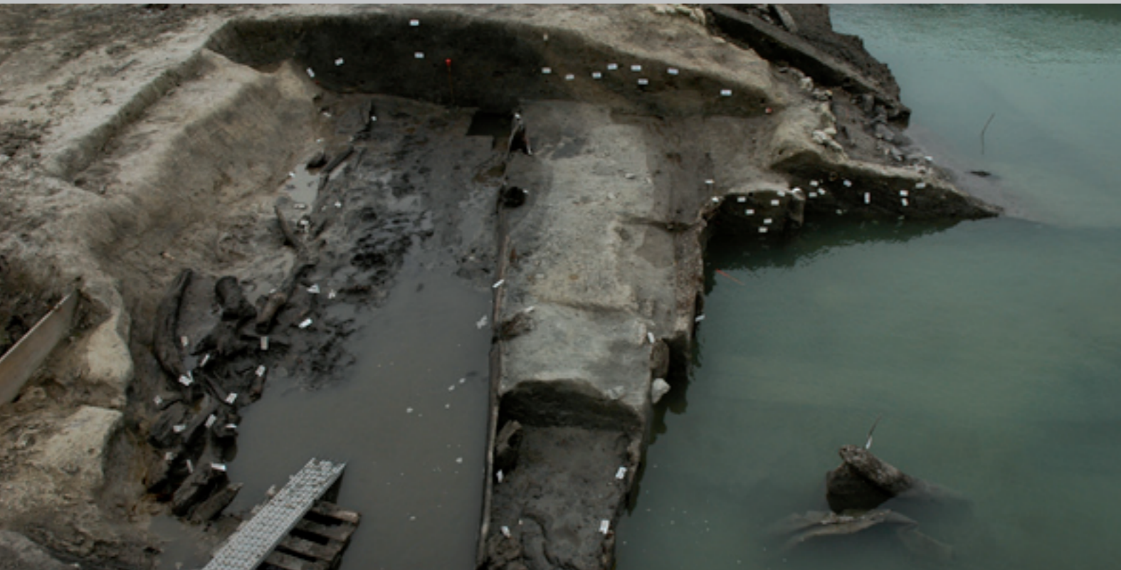
Conditions de la fouille de la rivière sans pompage

Maquette : I. Pasquier, Inrap Centre-Île-de-France - Février 2007