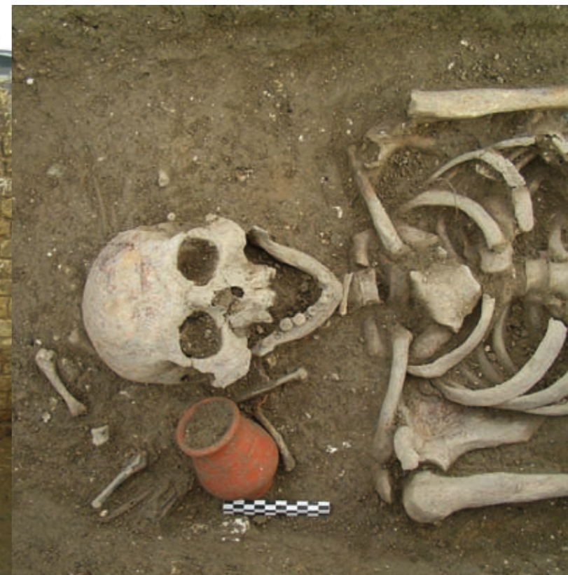
Sépulture avec un vase et une volaille en offrande

Le III e siècle correspond à une grave crise urbaine à laquelle Samarobriva n'a pas échappée. Les quartiers orientaux de la ville sont abandonnés et le secteur de La Vallée sert alors de décharge publique, puis de cimetière entre la fin du III e et le IV e siècle. Un peu plus de deux cents tombes ont été mises au jour. Il s'agit de sépultures à inhumation, essentiellement en cercueil. Si la plupart d'entre elles n'ont pas livré de mobilier funéraire, une petite partie renfermait des vases, des verreries, des monnaies ainsi que de nombreux bijoux en bronze, en argent et en or. L'absence de matériel peut marquer le niveau social inférieur du défunt, mais une modification des modes d'inhumation n'est pas à exclure à cette période qui voit l'apparition du christianisme à Amiens. Grâce à d'excellentes conditions de conservation, l'étude des ossements, croisée avec celle du mobilier, devrait permettre d'obtenir une image détaillée d'une partie de la population amiénoise de la fin de l'Antiquité, de sa composition sociale, ethnique et de son état sanitaire (alimentation, maladies...)