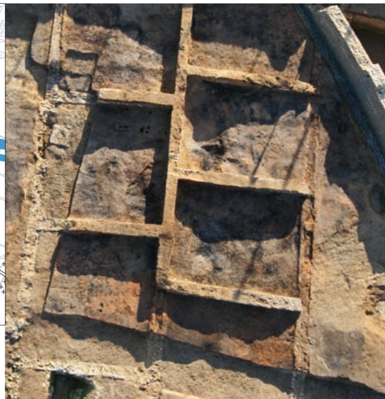
Vue partielle des entrepôts

La mise au jour de ce vaste ensemble constitue une découverte importante pour la compréhension de l'organisation générale de la ville (huit entrepôts ont été reconnus, dont la surface de stockage est de 3000 m 2 , mais d'autres sont possibles). Elle nous permet également de mieux appréhender le rôle économique que Samarobriva a joué au sein de la province de Gaule Belgique. Le terme de nœud commercial prend ici toute son importance.