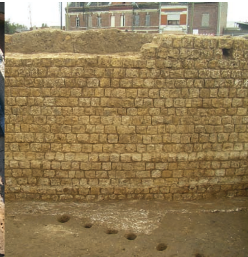
Mur du théâtre (détail)

Un incendie détruit les entrepôts vers 120 après J.-C. ; le terrain ainsi libéré voit la construction d'un vaste édifice public en hémicycle. Celui-ci n'a été que partiellement dégagé mais un certain nombre d'éléments permettent d'avancer l'hypothèse d'un théâtre. L'arc de cercle formé par les gradins se développerait sur environ 120 à 140 mètres de diamètre jusqu'aux anciens entrepôts de la SERNAM, de l'autre côté de la rue Legrand d'Aussy, et à l'emplacement des voies ferrées. Le monument s'adossait à une légère pente naturelle et ouvrait au nord vers la Somme. Le théâtre était desservi par une rue qui bordait le mur de façade, du côté de la rue de La Vallée et, semble-t-il, par une vaste esplanade dont certains éléments apparaissent à l'ouest du monument. Compte tenu de la surface estimée de l'édifice dont une petite partie seulement a été fouillée, on peut estimer sa capacité à plus de 5000 spectateurs. La mise au jour de ce monument public constitue également une découverte majeure qui contribue à compléter notre vision de la parure monumentale de la ville antique, preuve supplémentaire de son importance. Samarobriva n'avait véritablement rien à envier à ce sujet aux villes de Gaule méridionale, d'Afrique du Nord et d'Italie.