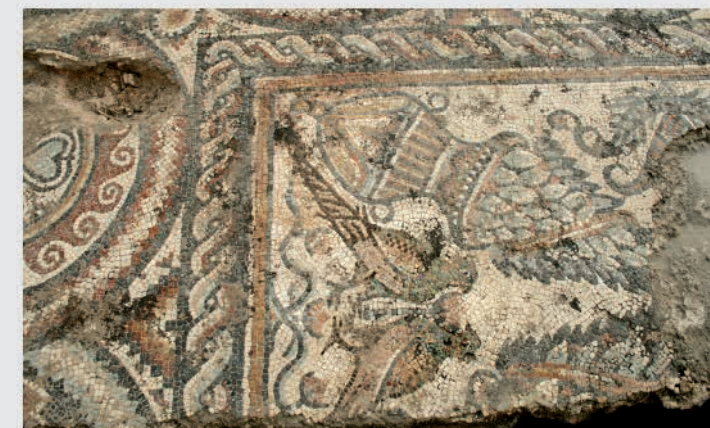
Détail de la mosaïque dégagée lors de l'opération archéologique en cours

paléochrétiennes. Ainsi, un pavement de mosaïque qui décorait vraisemblablement le sol d'une pièce du palais de l'évêque a été dégagé. Au centre du tapis mosaïqué on retrouve des cratères d'où s'échappent des bouquets végétaux et deux paires de paons affrontés, typiques de l'iconographie paléochrétienne (VI e siècle). Le tout encadré de tresses polychromes et de roues formant des compositions géométriques symétriques (nœuds de Salomon bordés de filets dentelés, composition de trèfles encadrés de vaguelettes...).