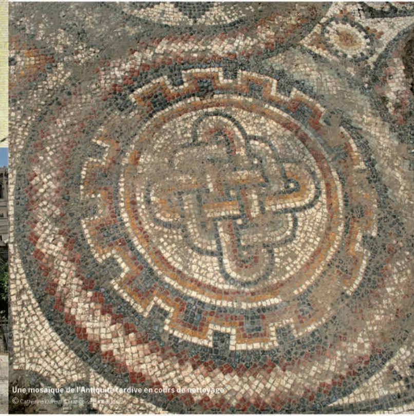
Une mosaïque de l'Antiquité tardive en cours de nettoyage