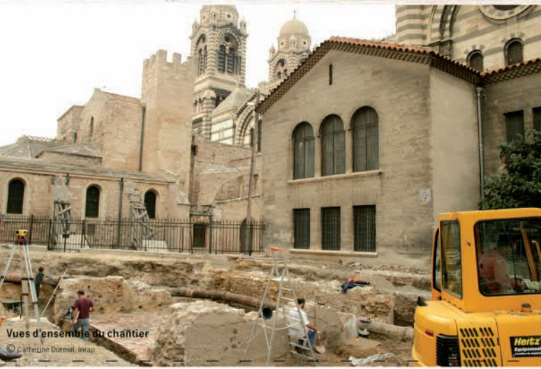
Vues d'ensemble du chantier