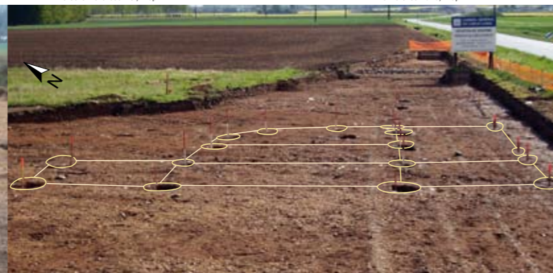
Hypothèse de restitution