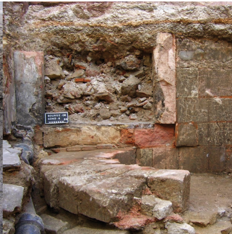
Une cave moderne mise au jour entre les immeubles Labourdette, quelques décimètres sous le goudron.