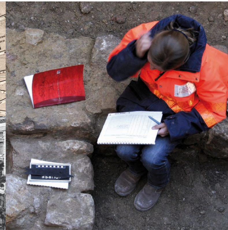
Enregistrement d'un mur antique dégagé lors du diagnostic.