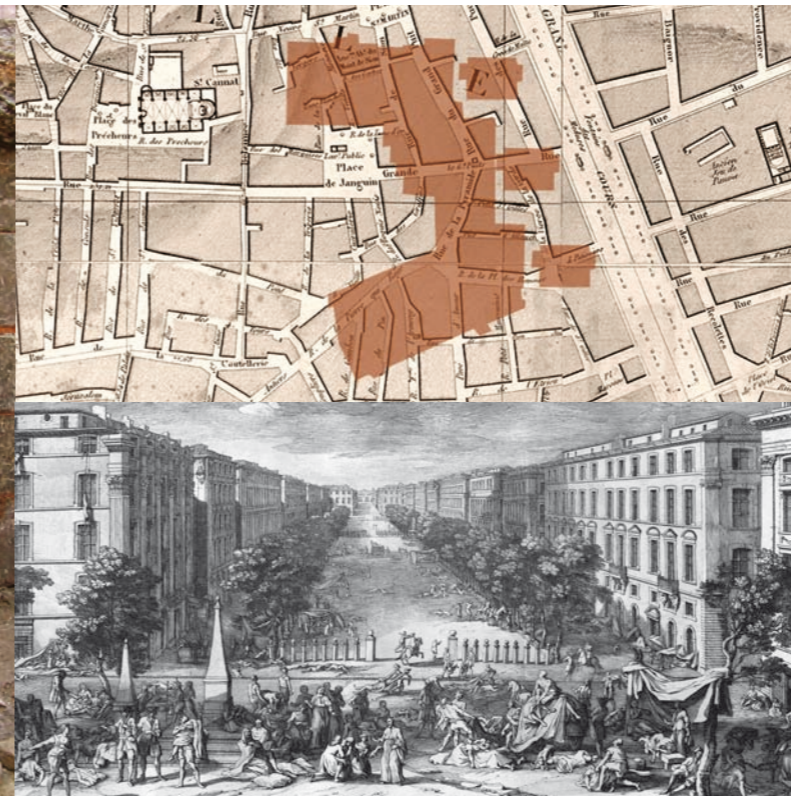
La ZAC de la Bourse superposée à la ville moderne. Plan Desmaret 1824 Le Cours Belsunce lors de la Grande Peste de 1720. Gravure de J. Rigaud