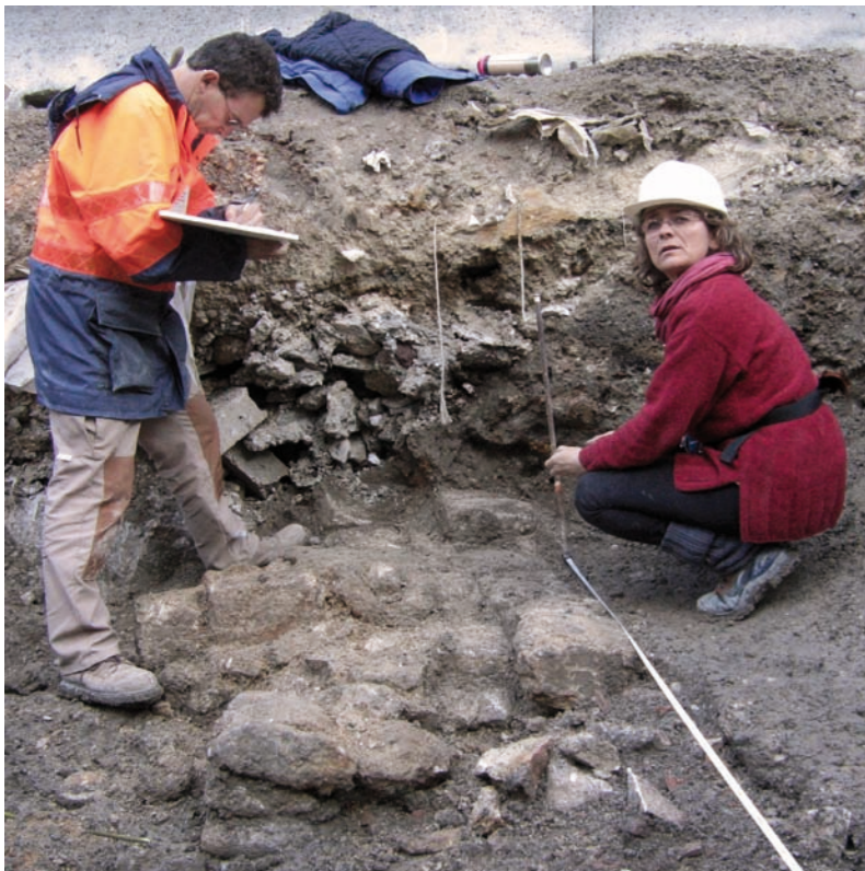
Relevé du premier mur dégagé dans le sondage 1.