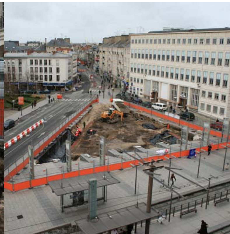
Début du décapage archéologique place de Gaulle Au 1 er plan, quai de la ligne de tram n°1 ; la rue des Carmes au fond