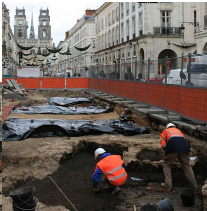
Les tous premiers jours de la fouille rue Jeanne d'Arc