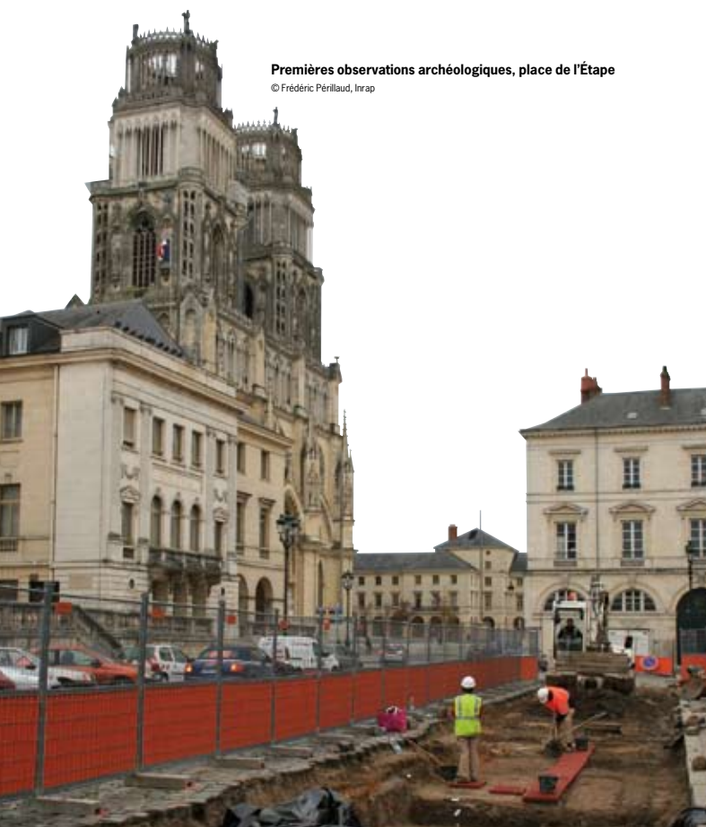
Premières observations archéologiques, place de l'Étape