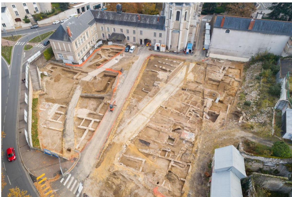
Vue générale du chantier vers l'est à la fin du premier décapage

L'opération de fouilles archéologiques préventives, prescrite par l'État (DRAC Centre-Val de Loire) est menée par l'Institut de recherches archéologiques préventives (Inrap). Elle a débuté le 18 octobre 2021 et s'achèvera en octobre 2022.