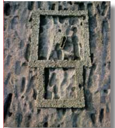
Vue verticale de l'église carré de Saleux (X e siècle).