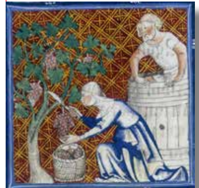
Vendanges en septembre : une femme avec un couteau et un panier recolle le raisin tandis qu'un homme dans le tonneau écrase les grappes. In "Breviari d'Amour" par Matfré Ermengau de Béziers, 1375-1400. British Museum.

Diverses lampes, écuelles, coupes ou encore peignes illustrent cette vie campagnarde. Des ossements témoignent des différents problèmes de santé rencontrés au Moyen Âge.