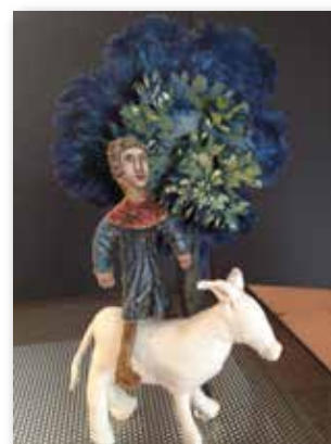
  Les Chevreux supr matistes