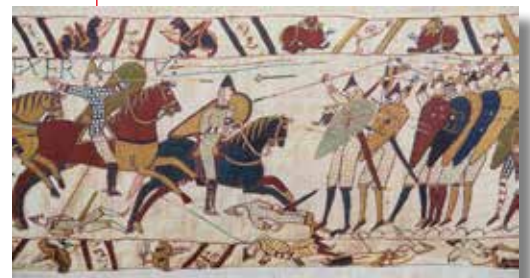
Tapiserie de Bayeux.

Du xii e au xvi e siècle : second Moyen Âge