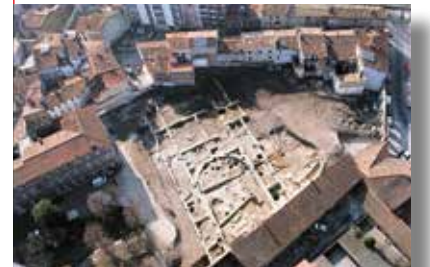
Chantier de fouilles à Toulouse.