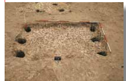
Vestiges d'un fond de cabane à six poteaux, vii e - viii e siècles, Saleux (Somme), 1993.

Ainsi, depuis une trentaine d'années, des milliers de sites, en milieu urbain comme en zone rurale, ont été fouillés, étudiés, comparés. La somme des informations issues de ces recherches a profondément enrichi la connaissance du passé. De "sauvetage" dans les années 1970, l'archéologie