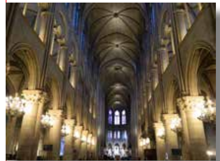
Notre-Dame de Paris.

Autre fait marquant, la papauté, inquiète de l'insécurité qui règne dans les rues de Rome, s'installe à Avignon en 1309.