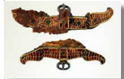
Fermoirs d'aumônière en décor cloisonné (v e siècle).