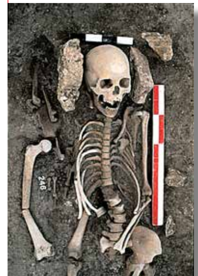
Sépulture des ix e -x e siècles de notre ère mise au jour lors des fouilles menées en 1993 sur le site "les Coutures" à Saleux (Somme).