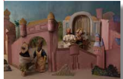
Scène de film.

Le premier film, le Marchand et le pèlerin , raconte la rencontre entre deux hommes sur les routes. Le marchand s'en retourne à Gênes se réapprovisionner en poivre, gingembre, cardamome... Il offre du pain au pèlerin fatigué et affamé qui revient de Saint-Jacques-de-Compostelle, comme en témoignent les insignes qui arbore sur son habit. Ils décident alors de voyager ensemble, échangeant leurs expériences et souvenirs de voyage. Malheur à eux ! Un hors-la-loi surgit d'un fourré, et emporte mules, bourses et draps de laine, mais laisse au marchand ses lettres de change... L'or sauvé, les deux compères arrivent à l'auberge. Le pèlerin, qui n'en a que le nom et profite de l'hospitalité des moines et de la bonté des gens, vole les parchemins pendant la nuit. Mais le marchand de Gênes n'est pas dupe et le faux pèlerin ne devient qu'escroc raté.