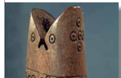
Tour (Roc) d'un jeu d'échecs en bois de cerf, seconde moitié du x e siècle, Pineuilh (Gironde).