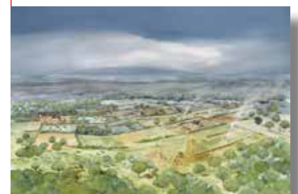
Reconstitution de paysage mérovingien (aquarelle).

Le visiteur incarne un archéologue de terrain. À l'aide de deux outils réels (pinceau et raclette), il recherche des objets virtuels : des noyaux de prunes, un bout de mâchoire d'ours, un tesson de céramique ou un morceau de charbon de bois. Cette fouille lui permet de comprendre d'une part la stratigraphie, et d'autre part le travail minutieux et passionnant d'un archéologue sur le terrain. Une activité ludique, une véritable "chasse au trésor" !