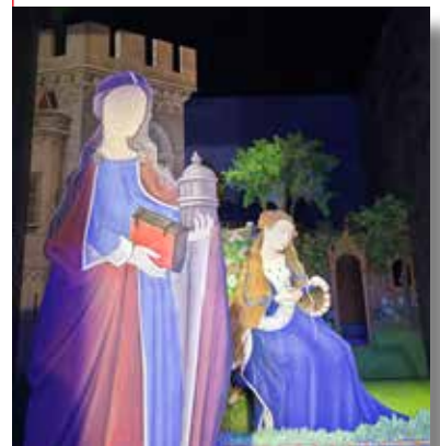
Hildegarde de Bingen.