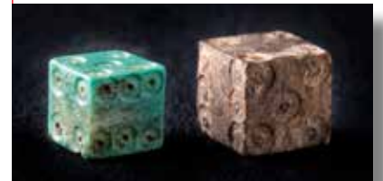
Dés à jouer mis à jour dans le chantier de la cathédrale de Strasbourg.

Les relations de vassalité ou de suzeraineté sont extrêmement complexes. Elles sont basées sur une fidélité personnelle et les liens ne cessent qu'à la mort de l'un des partis. Au VIII e siècle, les rois carolingiens font des comtes et des ducs des relais de pouvoir, instaurant alors ces liens de vassalité. Les siècles suivants, cette relation s'étend à l'ensemble de la société, formant une cascade de relations complexes. Plus un seigneur a de vassaux, plus sa puissance s'affirme. Or, un vassal unique peut prêter serment à plusieurs seigneurs, ce qui n'est pas sans poser problème en cas de conflits.