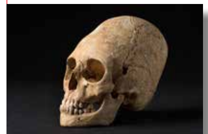
Crâne volontairement déformé de Hun (v e siècle).