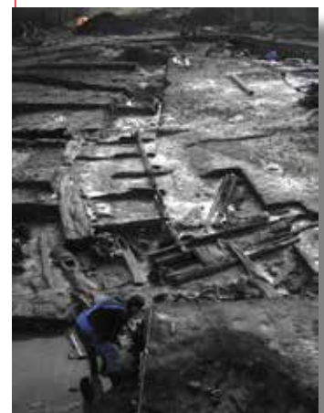
Rebord oriental de l'enceinte de l'habitat aristocratique de Pineuilh (Gironde) [fin du X e siècle].

Erik le rouge était contemporain du roi scandinave Harald, surnommé "La dent bleue", autrement dit "Bluetooth", en anglais. C'est en référence à ce roi que le fabricant suédois Erikson a baptisé sa technologie de communication sans fil "Bluetooth".