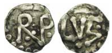
Dernier de Lyon sous Pépin le Bref.

À la fin du X e siècle, Hugues Capet est élu roi des Francs. Il impose la règle de succession pour le fils aîné ainsi que l'indivisibilité du royaume. Les différentes branches de cette dynastie, Bourbons et Valois, règneront jusqu'à la Révolution française. Les chiffres arabo-indiens sont introduits par les Arabes occidentaux, et l'art roman fait son apparition en Italie. Otton I er , roi de Germanie, rétablit l'empire chrétien et nomme les évêques, prenant alors le contrôle des élections papales.