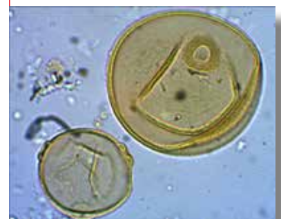
Pollen de bruyère médiéval vu microscope optique.

Les troncs servent à la construction des bâtiments et aux grands travaux d'aménagements, mais aussi à la menuiserie, à l'ébénisterie, au charronnage (construction de charrettes), ou encore à l'artisanat et à la fabrication des outils. Les rejets sont utilisés pour la vannerie, les clôtures ou les palissades, et l'écorce, mixée à des cendres, donne engrais, teintures, savons et sert aussi à la fabrication du verre. Les arbres étaient aussi porteurs d'une importance symbolique