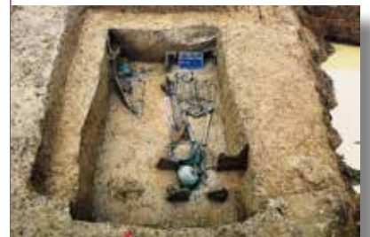
Tombe masculine de Saint-Dizier (525-550).

La damasquinure, technique d'orfèvrerie venant de Damas en Syrie, permet d'incruster un décor d'argent ou de laiton sur un métal moins noble, fer ou acier. Les artisans du premier Moyen Âge l'utilisaient fréquemment pour orner des boucles et plaques de ceintures, des fibules ou encore des pommeaux d'épée. Ici, le visiteur incruste des fils dans une boucle de ceinture qui reprend les motifs médiévaux. Plusieurs plaques-boucles damasquinées de cette époque sont présentées. Des pièces de qualité à admirer !