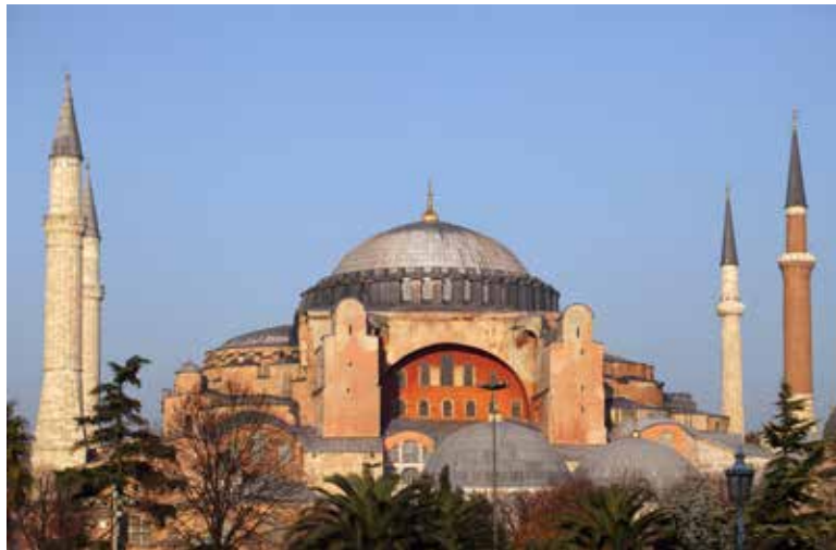
Cathédrale Sainte-Sophie (Turquie).

Révolution d'envergure en 1450, Gutenberg invente l'imprimerie, et reproduit la Bible, avec ses caractères mobiles de plomb.