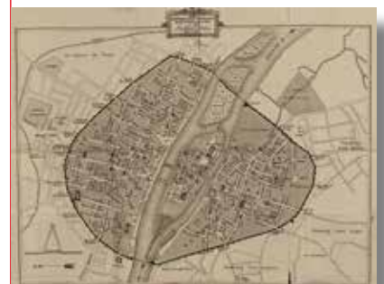
Le Dit des rues de Paris.

En 1253, sur l'immense église de l'abbaye cathédrale de Westminster, on dénombre 39 tailleurs de pierre, 15 marbriers, 26 maçons poseurs, 32 charpentiers, 2 peintres, 13 polisseurs de marbre, 19 forgerons, 14 verriers, 4 plombiers, soit en tout 164 artisans auxquels s'ajoutent plus de 200 manœuvres. Au total : 367 personnes. Leur ravitaillement exige une véritable organisation : élevage d'animaux, porteurs d'eau, etc.