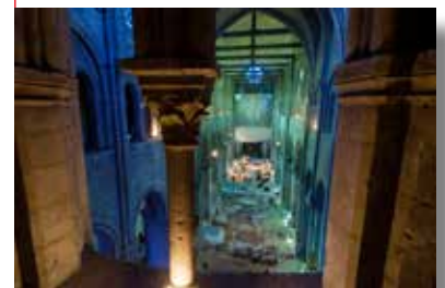
Chantier de fouilles.

Institut national de recherches archéologiques préventives