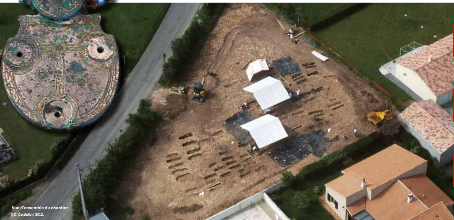
Vue d'ensemble du chantier © D. Castiglioni 2012.

Code opération : F. 101385 ; coordonnées Lambert III étendu : X = 1 423 810 ; Y = 61140 ; Conception graphique : F. Bambagioni © Inrap, mai 2012.